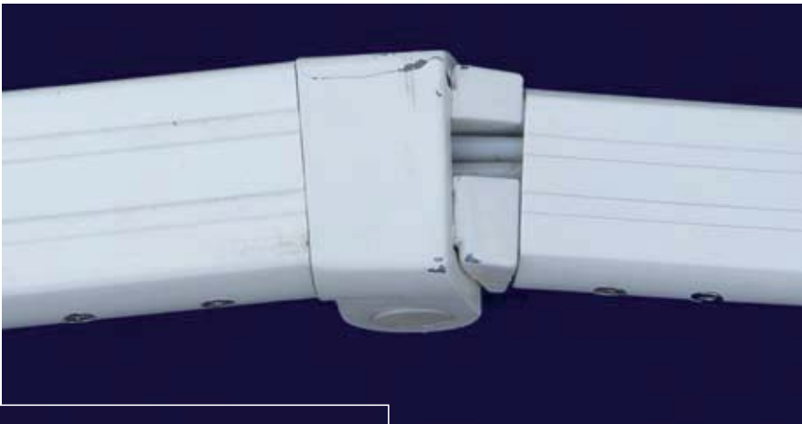
Bruch des Mittelgelenks durch unkontrolliertes Herausfahren der Markise.