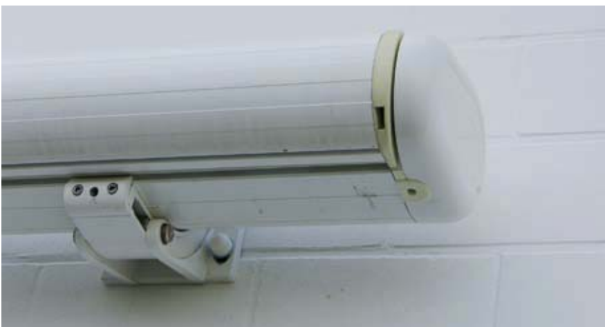
Deutliche Verfärbungen der Kunststoffteile nach nur 18 Monaten durch nicht UV-beständiges Material.

Kundendienst kommt und alles wird gut. Aber weit gefehlt, kein Kundendienst, viele Telefonate und im Ergebnis