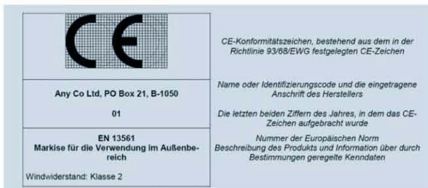
Bild ZA.2 — Beispiel für Angaben in den handelsüblichen Begleitdokumenten

den, wenn sie für den beabsichtigten Verwendungszweck geeignet sind. Die wesentlichen Anforderungen werden dabei von technischen Ausschüssen in Grundlegendokumenten formuliert und anschließend zu technischen Spezifikationen weiterentwickelt. Diese tech-