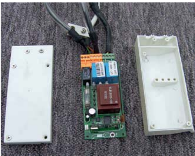
Schutzgehäuse der Steuerung ohne jede Abdichtung.

auf 230 Volt ausgelegt ist und somit hohe Anforderungen an Kabelverbindungen und Stromführung stellt. Wie vorher schon angemerkt konnte bei dem Gehäuse der Steuerungselektronik keine Abdichtung gegen Tropfwasser festgestellt werden. Gerade aufgrund der Positionierung des Steuerungskastens direkt unter dem einrollenden Markisentuch ein bedrohlicher Zustand, da hier durch Regen bei geöffneter Markise und Tropfenbildung bei eingefahrenem nassem Markisentuch ein Feuchtigkeitseintritt in das Gehäuse mit kompletter 230 Volt Stromführung erfolgen kann, und so ein massives Sicherheitsrisiko verursacht. Alleine die Wärmeentwicklung der Steuerung und die Möglichkeit eintretenden Tauwassers macht eine Abdichtung nach IP