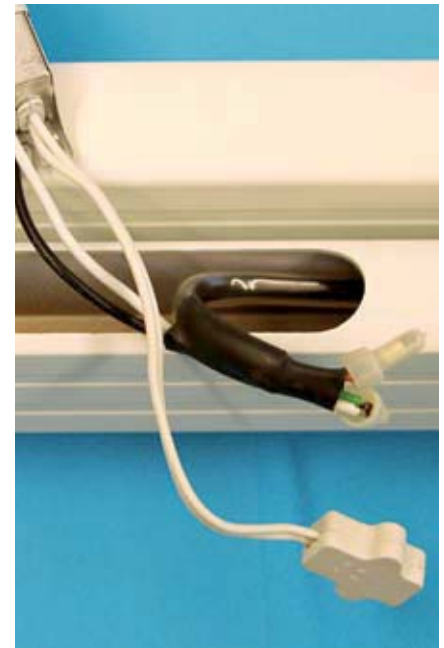
Nicht ausreichende Isolierung an Kabelverbindungen bei der 230 Volt Stromführung.

Schon bei der Betrachtung der neuen Gelenkarme fiel auf, dass die integrierte Beleuchtung im Unterarm