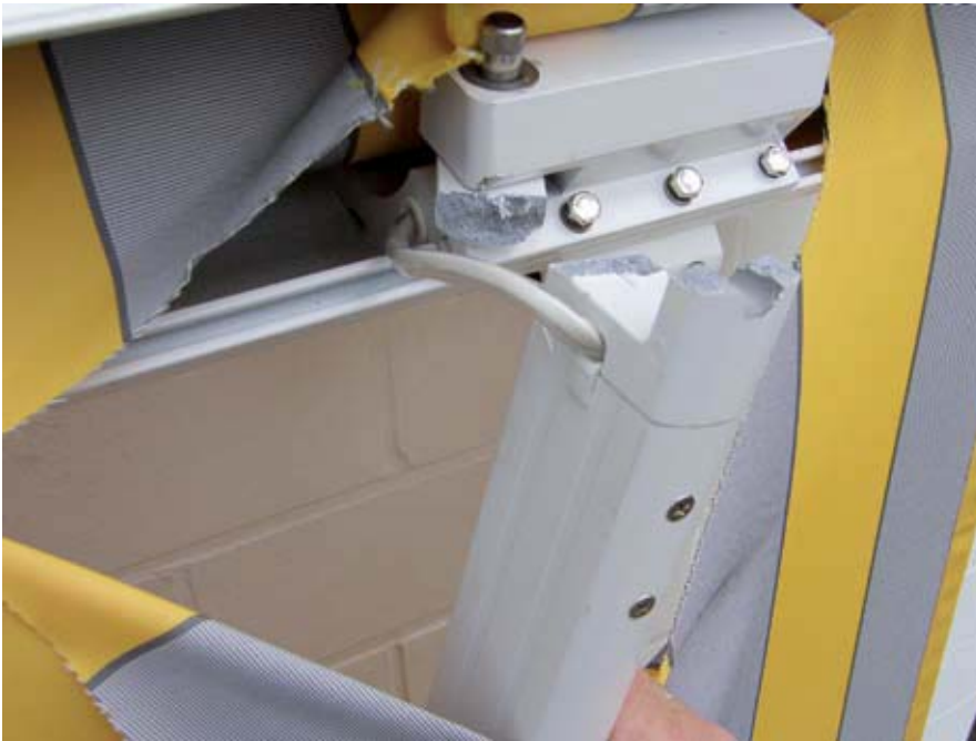
Ursache: Materialbruch in der Gabel des Oberarmgelenks.