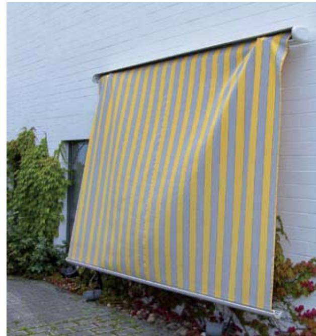
Totalversagen während der Prüfreihe durch Materialbruch.